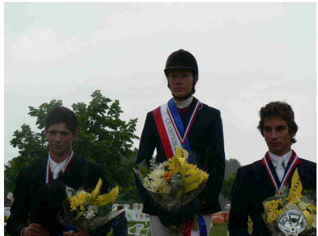
Podium juniors 2007