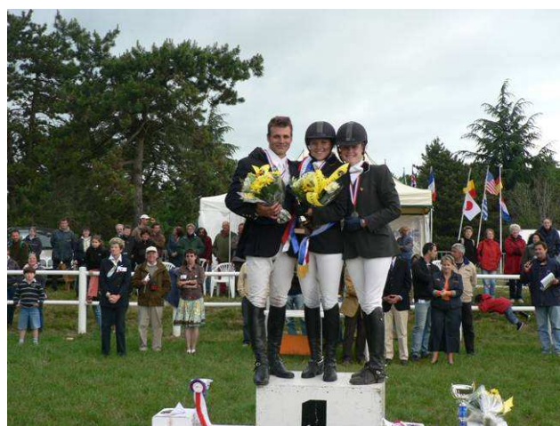
Podium championnat de France Jeunes cavaliers 2007.